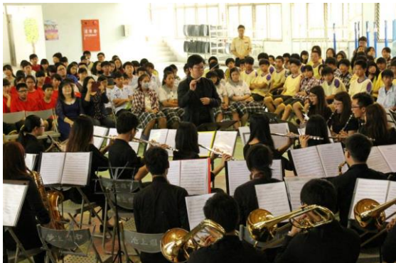
池上國中交流演出