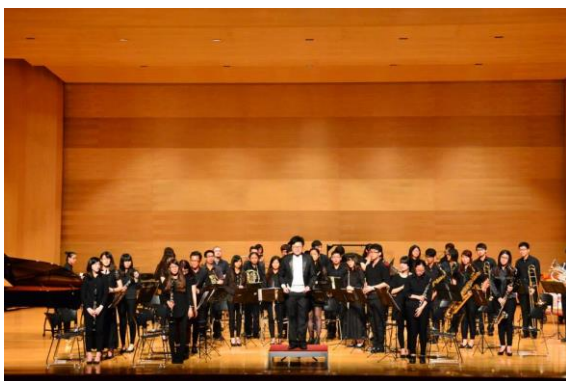
台東文化局演出&兩校交換紀念品